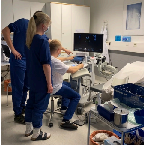
Opiskelijat tutustuvat kliinisen opettajan johdolla ultraäänilaitteen saloihin

Tarkoituksena on, että opiskelijat näkisivät mahdollisimman kattavasti erityyppisiä potilaita ja saisivat tutkia potilaita, jotta heidän kliininen silmänsä ja kädentaitonsa kehittyisivät. Lisäksi opiskelijat oppivat ohjaajan hyvällä esimerkillä kohtaamaan potilaita erilaisissa tilanteissa. Potilaan tutkimisen lisäksi opiskelijat lukevat potilastapauksiin liittyvää kirjallisuutta ja analysoivat yhdessä ohjaajan kanssa potilaalle mahdollisesti tehtyjä kuvantamis- tai laboratoriotutkimuksia. Opiskelijat oppivat myös näytteenottoa ja pientoimenpiteitä, kaikki kädestä pitäen ohjattuina. Näin oppimistilanne on sekä potilaille että opiskelijoille rauhallinen ja turvallinen.