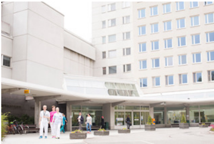
Vaasan Keskussairaala

Naistentaudeilla hajautusopetusta on ollut jo kymmenen vuoden ajan, eli vuodesta 2012. Vaasaan naistentautien hajautusopetukseen tulee nykyään neljä opiskelijaa/viikko ja Vaasassa järjestetään yhteensä seitsemän viikon aikana opetusta.